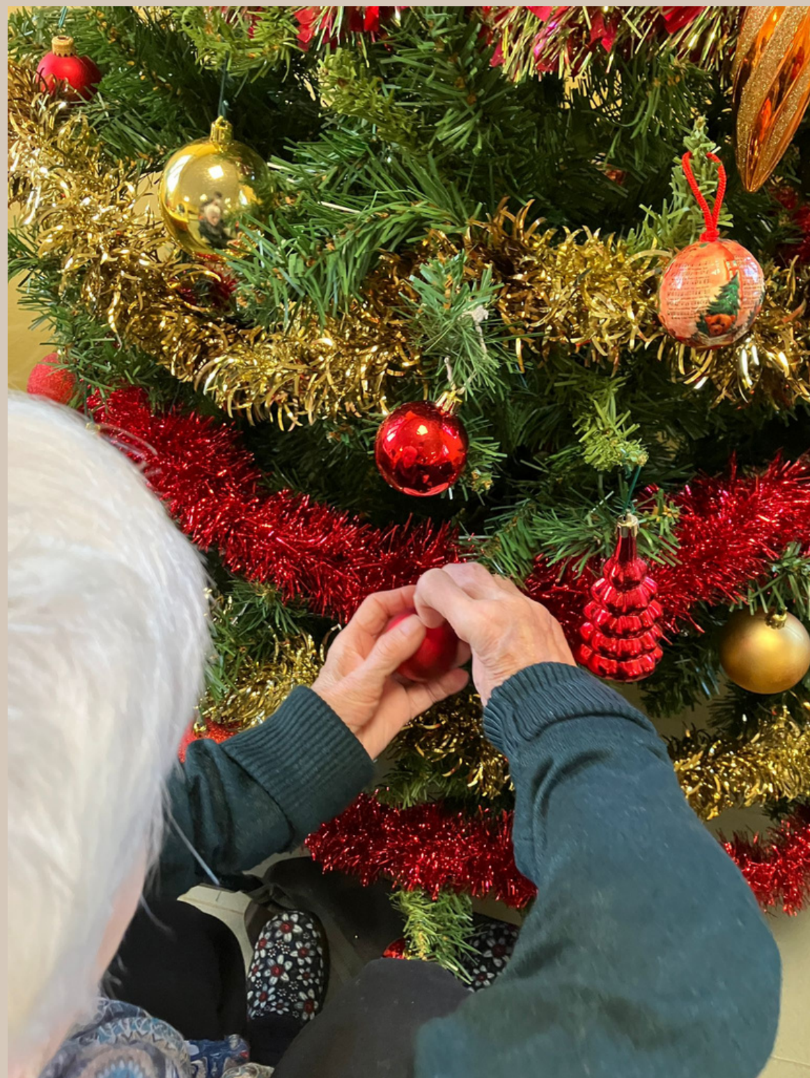
Facciamo l'albero insieme...