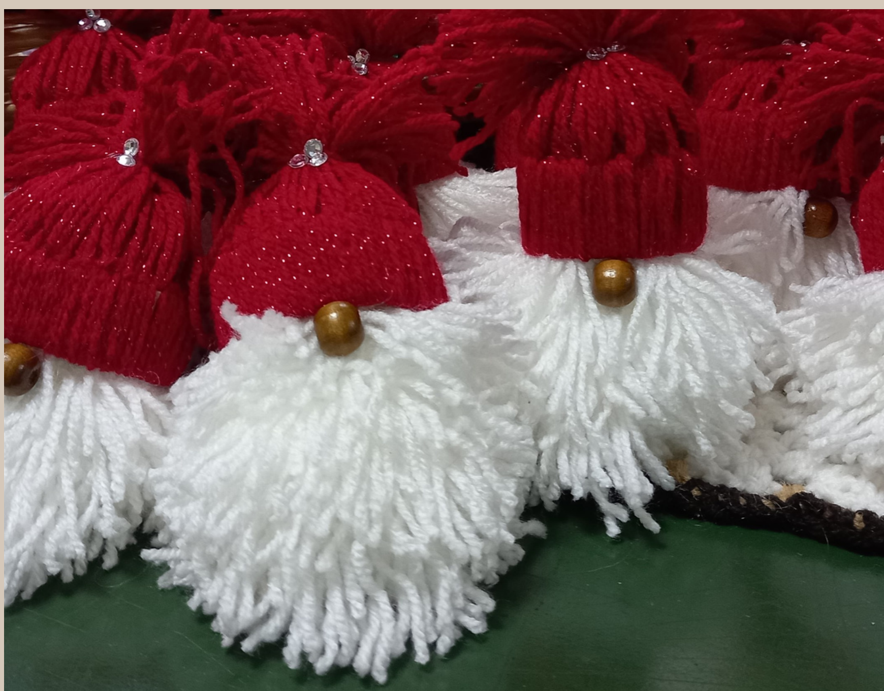
Decorazioni natalizie fatte a mano