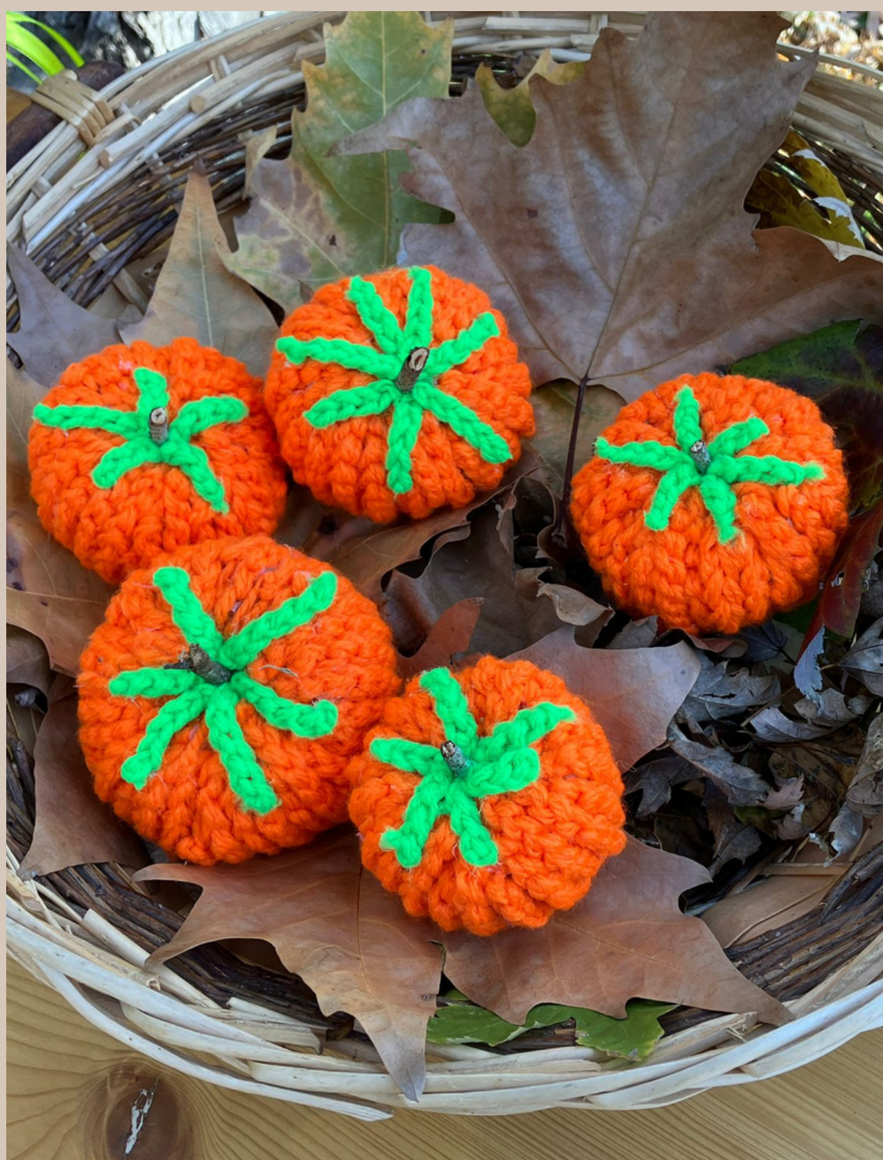
Zucche con carta di giornale e lana lavorata all'uncinetto