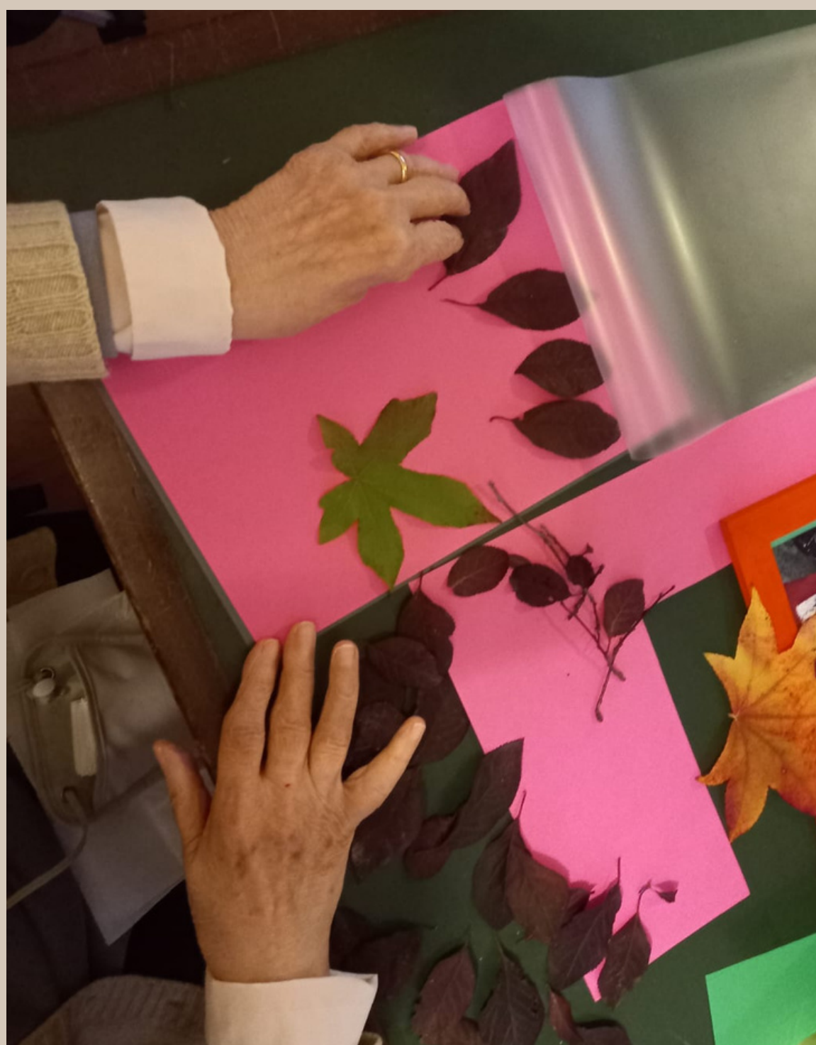
Segnalibri con le foglie