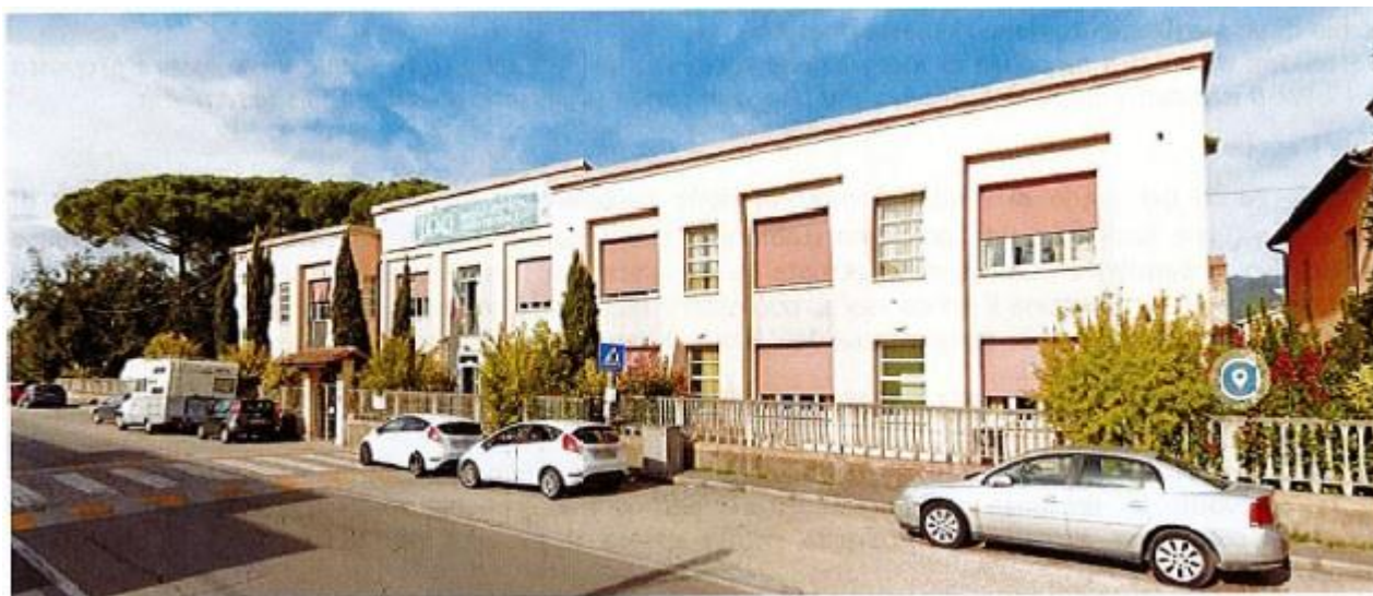
Vista della Struttura principale da Via Tosco Romagnola

Realizzazione una struttura dotata di piscina terapeutica e riabilitativa all'interno del complesso Remaggi denominata annesso 1