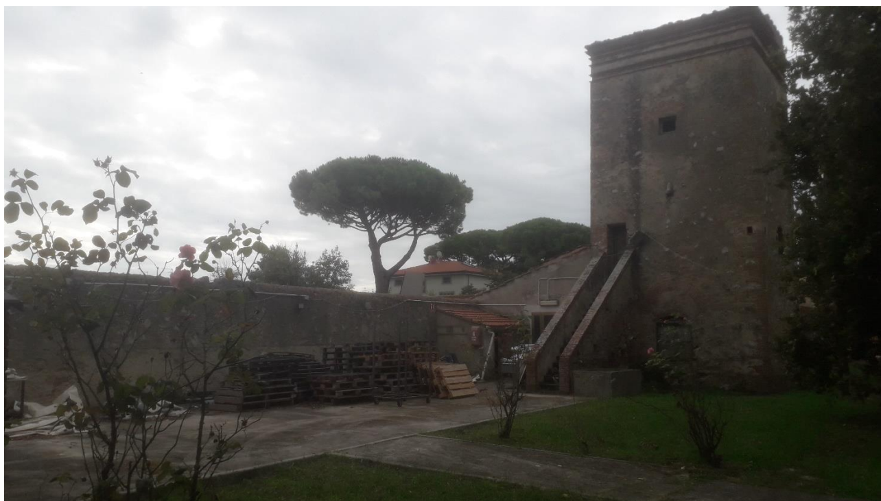
Vista lato nord torretta