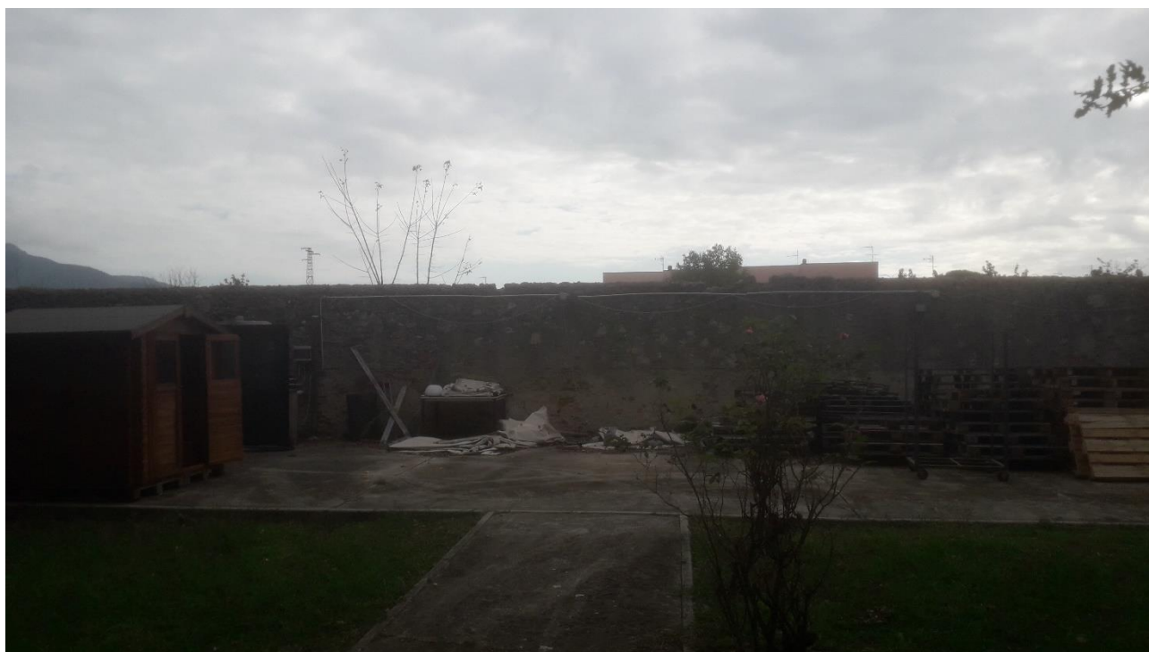
Vista lato nord torretta