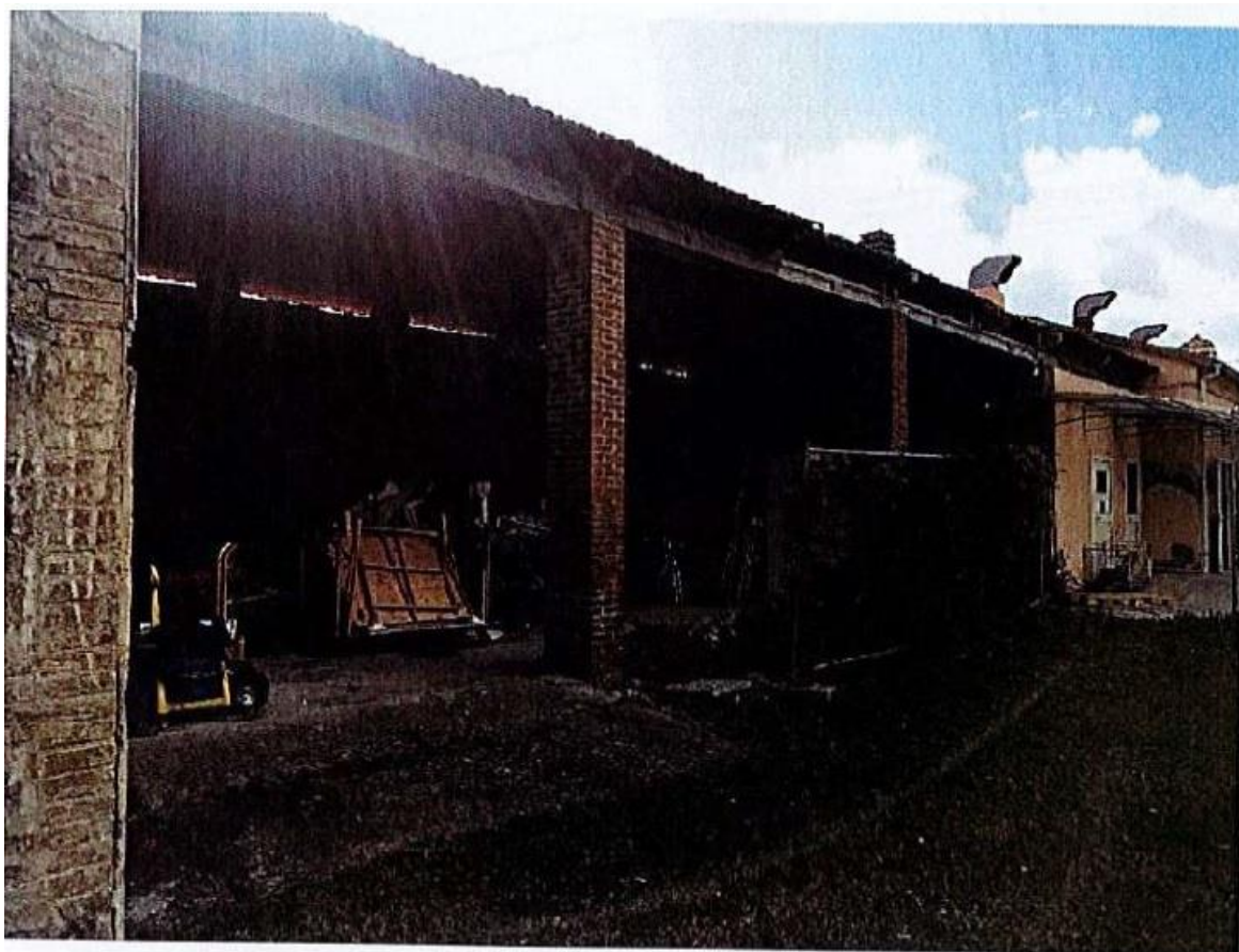
Vista sul fronte interno